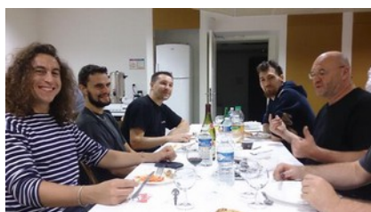
Un repas en toute convivialité

Pour l'ouverture de leur soixante dixième saison, les Concerts Classiques d'Epinal ont voulu marquer l'événement par un spectacle mêlant chant, théâtre et musique. Ce fut le bon choix si on en croit les auditeurs sortis ravis après près de trois heures dans le superbe théâtre de la Rotonde de Thaon.