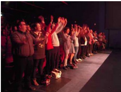
Le public conquis