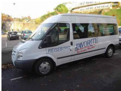
Le minibus a amené les artistes

Ce septet de cuivres autrichiens créé en 1992 revenait depuis la veille de concerts aux Etats Unis et repartait aussitôt après la prestation spinalienne se produire ce lundi à Zurich. Il faut dire qu'il donne environ 130 concerts par an dans le monde entier pour remplir des salles prestigieuses. C'est également un des ensembles de cuivres les plus demandés en Europe.