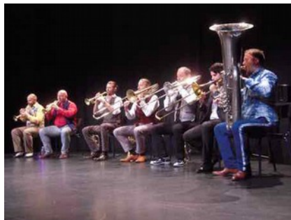
Une musique qui vit