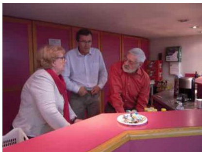
La buvette sera prête