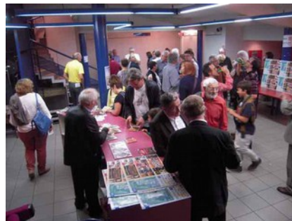
Les CD très bien vendus