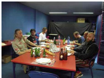
Un repas bien mérité