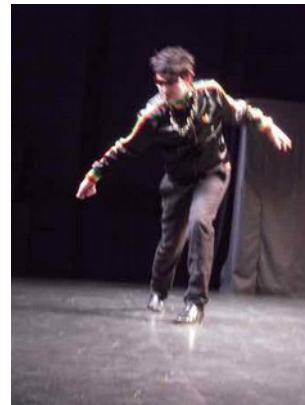
Une bonne humeur communicative

Dès leur arrivée sur scène les musiciens ont très vite happé la bonne humeur communicative. Il faut dire que leurs représentations émaillées de sketches burlesques offrent malgré tout un large répertoire de musiques. Doté d'un talent incontestable pour l'improvisation, ils savent trouver spontanément l'effet de surprise qui correspond au public dans les intermèdes qui relèvent du cabaret. Mais ne nous trompons pas, seuls ceux qui maîtrisent parfaitement leurs instruments peuvent oser de telles prestations. Leur but est de montrer au public que leur conception de la musique populaire dans toutes ses facettes n'est pas encore soumise au joug de l'industrie musicale, mais qu'au contraire elle vit. Y sont-ils parvenus ? Vraisemblablement pour une grande partie des auditeurs c'est sûr puisque leur seule réputation a rempli la salle bien avant le jour du concert et les CD proposés à l'entracte ont littéralement fondu.