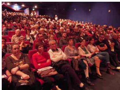
Un public de toutes générations