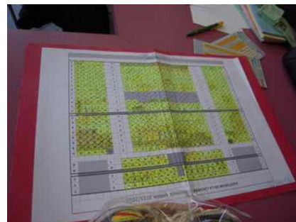
Impossible d'ajouter une place