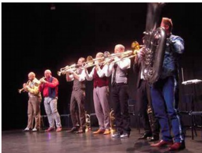
Les artistes maîtrisent parfaitement leurs instruments