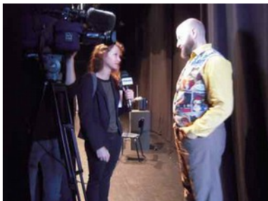
Vosges-Télévision questionne les artistes

Depuis deux séances l'association des Concerts Classiques d'Epinal a voulu diversifier sa programmation en proposant des concerts sortant de l'ordinaire pour les mélomanes amoureux des grandes œuvres de compositeurs prestigieux. Ce fut d'abord la première mondiale d'un récital accompagné avec le réputé Patrick Poivre D'Arvor vantant les pouvoirs de l'Amour. Ce dimanche après-midi autre diversion avec le Mnozil Brass pour un