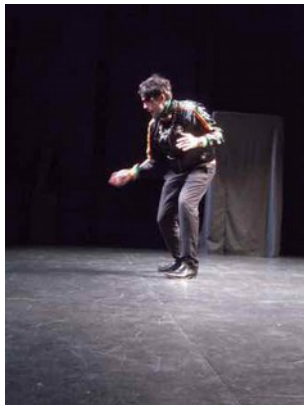
Des intermèdes de cabaret