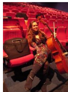
La soliste fait une pause après le voyage en voiture

Réunir deux artistes et une telle formation est presque une gageure que pratiquement seuls les responsables de l'association des Concerts Classiques peuvent mener à bien. Mais c'est sans compter sur les éléments qui se déchaînent : d'abord l'arrivée de la neige, en quantité, rendant les chaussées souvent capricieuses, puis le déraillement d'un train de fret à Blainville-Damelevières qui aurait pu compromettre le voyage du chef