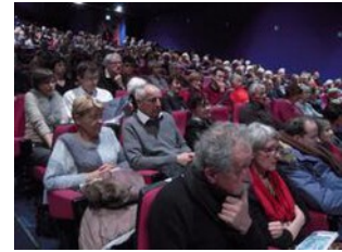
Le public est venu nombreux malgré les intempéries