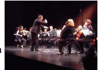
Le Chef a beaucoup donné de sa personne

Dés les premières notes, le Chef a montré combien il savait donner de sa personne pour mettre en valeur la qualité des œuvres, secondé par un orchestre sans faille. Puis est arrivée la soliste qui avec sa seule prestance a su envoûter la salle. Vêtue d'une très belle robe, son authentique présence se vit confirmée par une interprétation pleine de personnalité et avec une technique fluide.