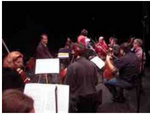
Tous arrivent pour la répétition générale