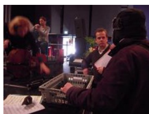
Le Président encore emmitoufflé règle le problème des pupitres