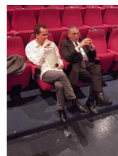
Le Président règle les détails avec le Chef

A peine arrivé, après une heure trente de routes enneigées et quelles routes, le président dû s'atteler à ces deux problèmes parmi bien d'autres ! En fin vers 14 h, la répétition générale pouvait commencer tout étant rentré dans l'ordre. Le travail sérieux fourni permet de se rendre compte de la valeur de chacun des éléments et de leur souci d'une musique irréprochable. Récompense pour les organisateurs, le public a bien rempli la salle malgré la météo capricieuse.