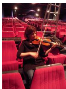
La violoniste répète dès son arrivée

ne restait plus qu'à attendre les musiciens de l'Orchestre voyageant également en voiture depuis Prague.