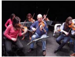
Chacun donne le meilleur de lui-même