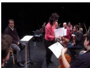
Distribution des partitions

soliste venue en voiture, avec son compositeur, de la région parisienne. Il