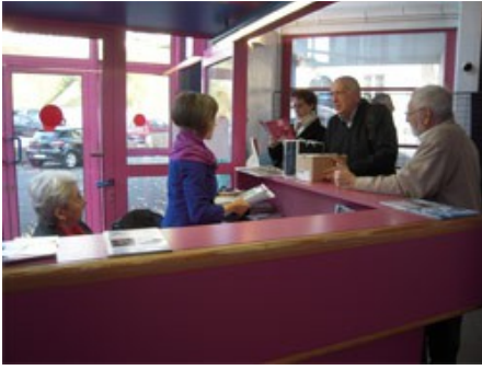
Préparation du placement du public

Pour le comité des Concerts Classiques, tout devait être prêt pour accueillir dans les meilleures conditions possibles.