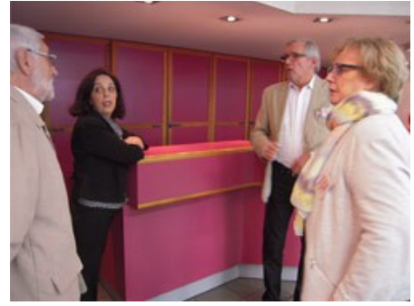
Répartition des tâches au sein d'une partie du comité

propice aux randonnées et le changement d'heure, a su venir nombreux communier avec ce duo proposé par les Concerts Classiques.