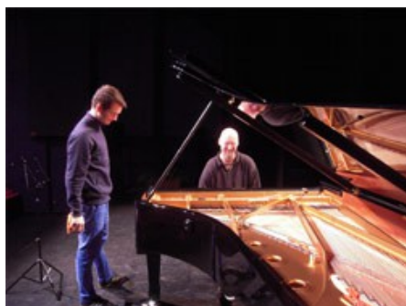
Un accordeur minutieux

prestigieux, comme un des plus talentueux de sa génération, a laissé glisser ses doigts sur les touches du piano avec une dextérité sans égale.