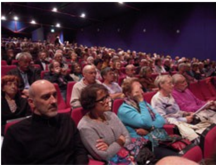
Plus de 300 personnes

C'est donc devant plus de trois cents mélomanes que ce couple a montré toute la grandeur de son talent. Inutile de dire l'enthousiasme de la salle qui a rappelé par trois fois les musiciens ravis qui se sont pliés de bonne grâce à leur souhait.