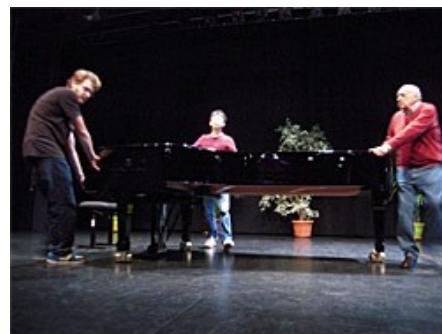
Mise en place du piano

Dès leur arrivée vers midi à l'Auditorium de La Louvière pour découvrir puis préparer la salle et effectuer une studieuse répétition, ces deux musiciens malgré la difficulté de la barrière de la langue, ont tout de suite