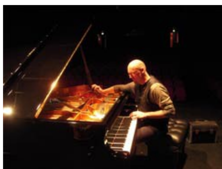
Un piano neuf bichonné par l'accordeur

Pour cette artiste exceptionnelle c'est un piano neuf de 142 000 euros qui était entre ses mains afin de bien mettre en valeur sa grande sensibilité. L'accordeur était en permanence avec elle afin de rôder l'instrument et exhiler parfaitement sa délicatesse.