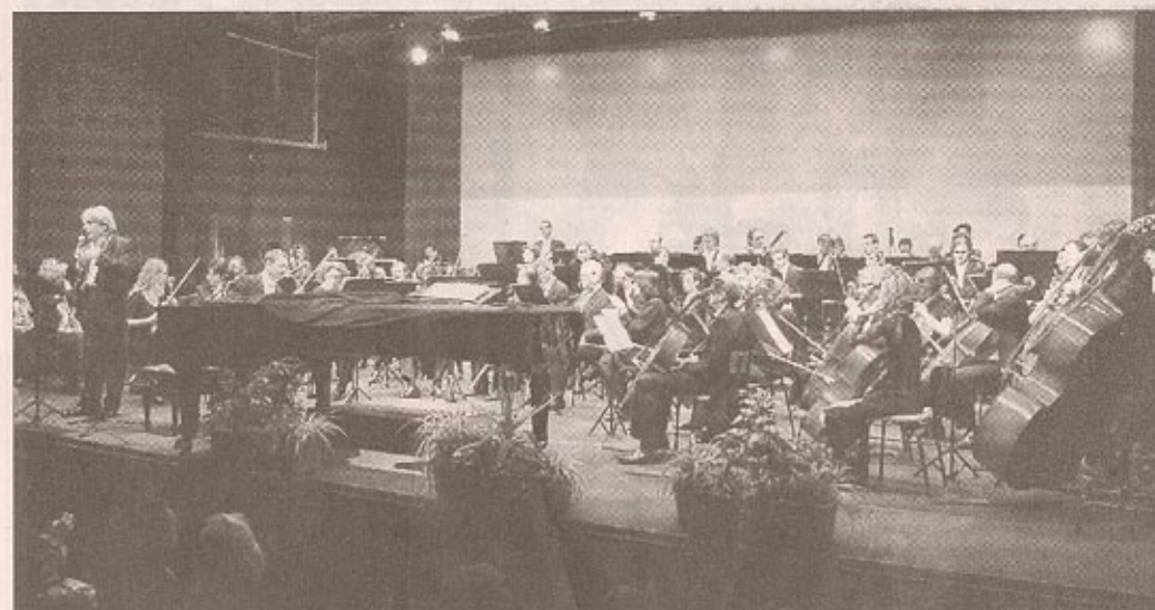
Jacques Mercier, à la tête de l'orchestre national de Lorraine, a commenté les différentes œuvres.