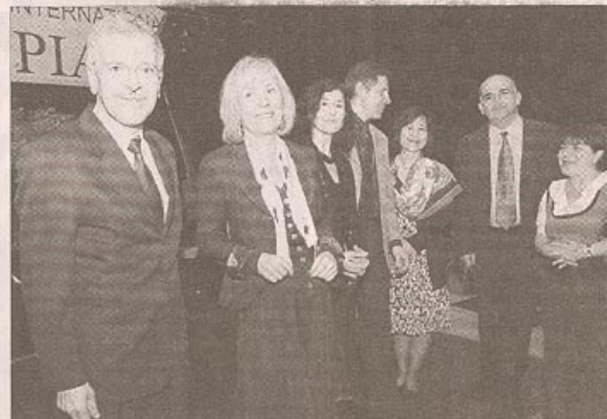
Le tirage au sort a eu lieu hier après-midi, sous l'œil de mélomanes avertis.

Le tirage au sort de l'ordre de passage pour le concours international de piano a eu lieu hier au théâtre municipal. Tous les candidats étaient là. Ou presque. Sur la petite centaine de pianistes attendus, 73 se sont présentés, avant que ne commence la petite cérémonie. Les choses sérieuses débutent aujourd'hui au théâtre municipal avec la première épreuve : un mouvement d'une Sonate de Haydn, une étude de Chopin ou, par tirage au sort, une étude de Mendelssohn, Scriabine, Liapounov, Moszkowski et une œuvre au choix du concurrent. Accès gratuit.