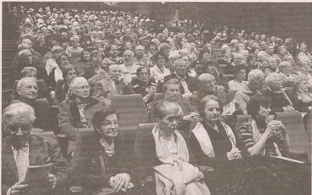
L'auditorium de la Louvière était comble hier. Il pourrait être de même à la Rotonde de Thaon-les-Vosges l'an prochain.