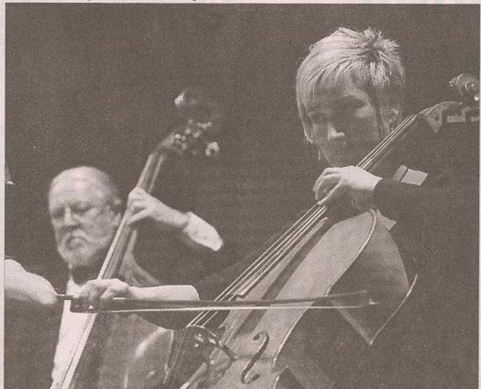
C'est la formation mosellane qui avait inauguré le rendez-vous du Nouvel An spinalien il y a neuf ans.

La retransmission par la télévision publique du concert donné à Vienne a réellement lancé le phénomène en France et en Europe. Cette idée d'un moment magique à partager à l'aube de chaque nouvelle année a fait florès et sans aucun doute participé à un regain d'intérêt pour la musique classique.